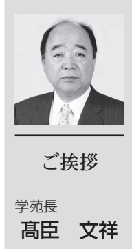
ご挨拶 学苑長 高臣 文祥

皆様には、お変わりなくお元気で活躍のことと存じ、お慶び申し上げます。 日頃は同窓会の振興、母校の発展にご理解ご協力を賜り、厚くお礼申し上げます。 母校の近況は、学苑長先生をはじめ