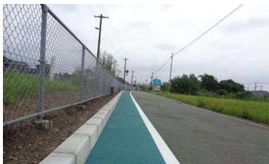
J R 一身田駅周辺通学路グリーンベルト