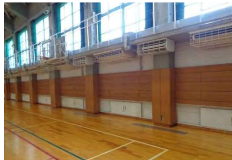
第1体育館エアコン